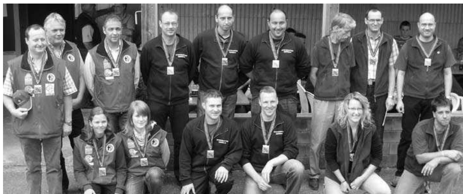
(von links nach rechts): Thörishaus 1 (2.Rang), Oberbalm 1 (1.Rang) und Pieterlen 2 (3.Rang)