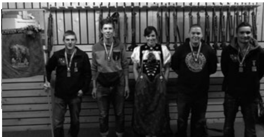
Podest der Jungschützen

Unterverbände: 1. SSV Schwarzenburgerland 125,06 Punkte (33 JS + 15 JJ Teilnehmer); 2. ASV Bern, 123,56 Punkte (18 JS + 2 JJ Teilnehmer); 3. Gürbe Schiesssportverband 121.20 Punkte (30 JS + 9 JJ Teilnehmer).